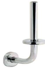
REF: CO-0211-I Acabado BRILLO