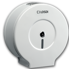
REF: CP-0203 Acabado EPOXY BLANCO