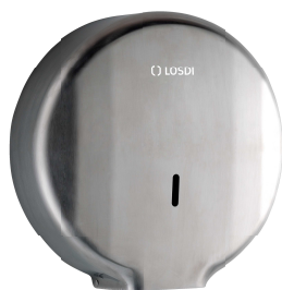
REF: CO-0207-S Acabado SATINADO