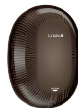
REF: CJ-5003-BL Couleur: NOIR