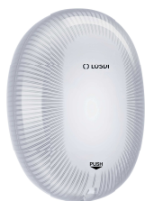
REF: CJ-5003-B Couleur: BLANC