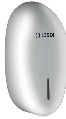
REF: CJ-1005 Finition BLANC