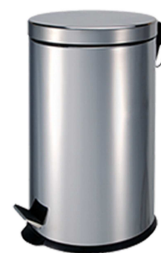
REF: MP-0612-S Finition BROSSÉ