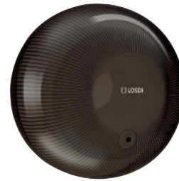
REF: CP-4000-BL Acabado NEGRO