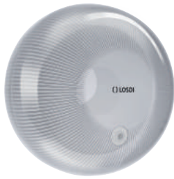
REF: CP-4000-B Acabado BLANCO