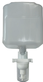
REF: CB-323 Acabado: GEL BLANCO