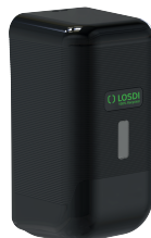
REF: CJ-3013-BL Acabado NEGRO