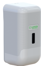
REF: CJ-3013-B Acabado BLANCO