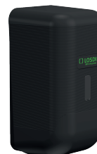
REF: CJ-3013-MT Acabado NEGRO MATE