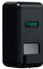
REF: CJ-3003-BL Colour NOIR