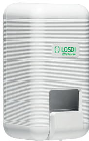
REF: CJ-3003-B Colour BLANC