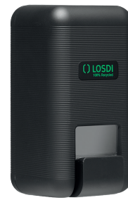
REF: CJ-3003-MT Colour NOIR MAT