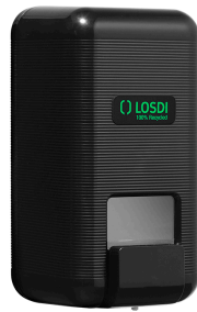
REF: CJ-3003-BL Acabado NEGRO