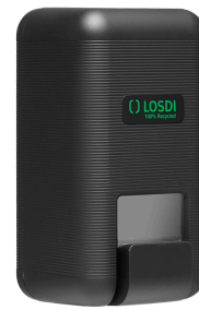
REF: CJ-3003-MT Acabado NEGRO MATE