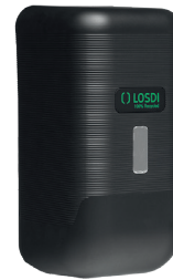
REF: CJ-3013-MT Colour NOIR MAT