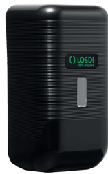
REF: CJ-3013-BL Colour NOIR