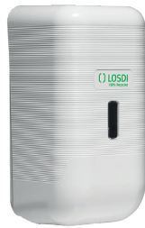
REF: CJ-3013-B Colour BLANC