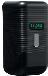
REF: CJ-3113-BL Colour NOIR