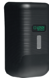
REF: CJ-3113-MT Colour NOIR MAT