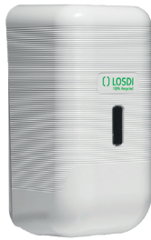
REF: CJ-3113-B Colour BLANC