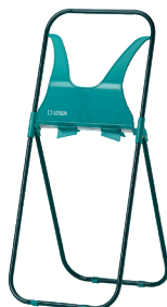
REF: CP-0524 Acabado GALVANIZADO Y LACADO EPOXY