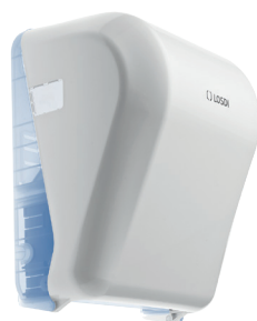
REF: CP-6525-B Acabado BLANCO