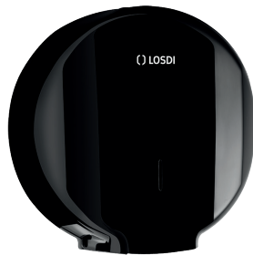
REF: CP-0204-C-BL Finition NOIR