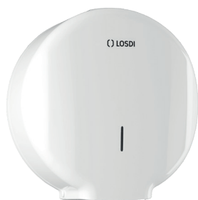
REF: CP-0204-B Finition BLANC