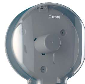
REF: CP-0204 Finition TRANSPARENT