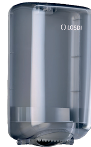
REF: CP-0528 Finition TRANSPARENT