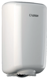
REF: CP-0528-B Finition BLANC