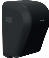
REF: CP-1525-BL Acabado NEGRO