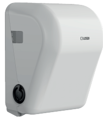
REF: CP-1525-B Acabado BLANCO