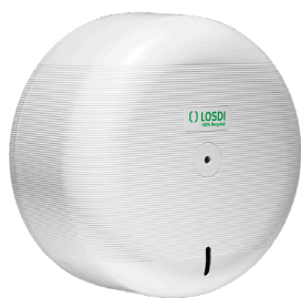
REF: CP-3000-B Couleur : BLANC