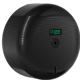
REF: CP-3000-BL Couleur : NOIR