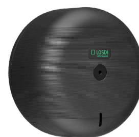
REF: CP-3000-MT Couleur : NOIR MAT