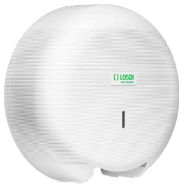
REF: CP-3006-B Acabado BLANCO