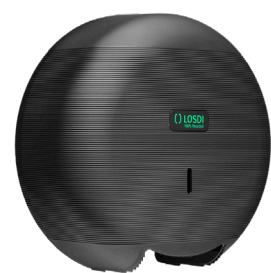
REF: CP-3006-MT Acabado MATE