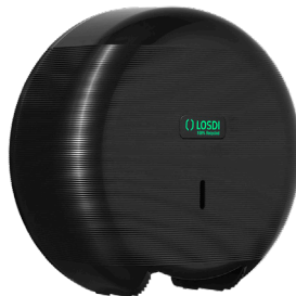
REF: CP-3006-BL Acabado NEGRO