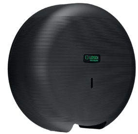
REF: CP-3007-MT Acabado MATE