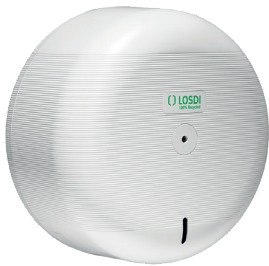
REF: CP-3000-B Acabado: BLANCO