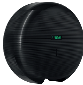
REF: CP-3007-BL Acabado NEGRO