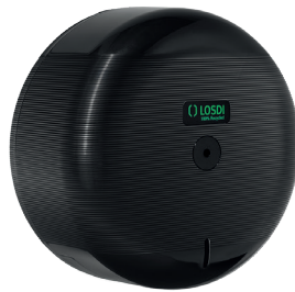
REF: CP-3000-BL Acabado: NEGRO