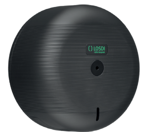
REF: CP-3000-MT Acabado: NEGRO MATE