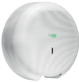
REF: CP-3007-B Acabado BLANCO