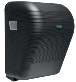
REF: CP-3525-MT Colour NOIR MAT