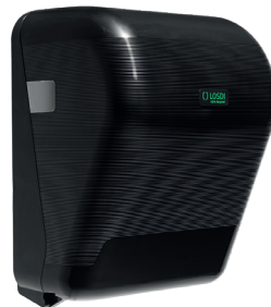
REF: CP-3525-BL Colour NOIR