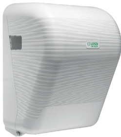
REF: CP-3525-B Colour BLANC