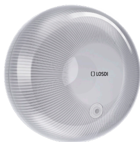
REF: CP-6000-B Acabado BLANCO