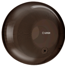
REF: CP-6000-BL Acabado NEGRO