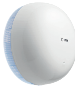
REF: CP-6100-B Acabado BLANCO