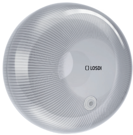
REF: CP-6000-B Colour BLANC