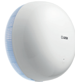
REF: CP-6100-B Colour BLANC