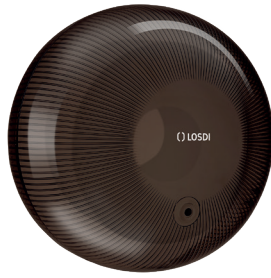
REF: CP-6000-BL Colour NOIR