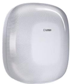
REF: CP-6009-B Acabado BLANCO