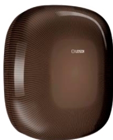
REF: CP-6009-BL Acabado NEGRO