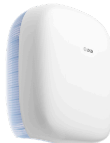
REF: CP-6109-B Acabado BLANCO