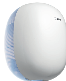
REF: CP-6110-B Acabado BLANCO