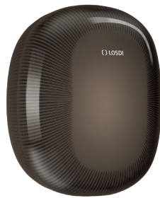
REF: CP-6010-BL Acabado NEGRO