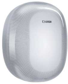
REF: CP-6010-B Acabado BLANCO