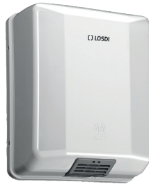
REF: CS-200-X Finition ABS BLANC