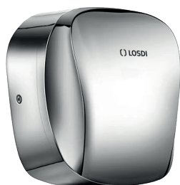
REF: CS-650-I/X Finition ACIER INOX BRILLANT