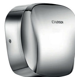
REF: CS-650-S/X Finition ACIER INOX BROSSÉ