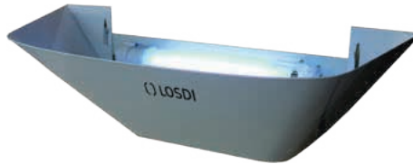
REF: CI-1X18-AD Acabado METAL LACADO BLANCO