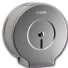
REF: CO-0202 Acabado SATINADO