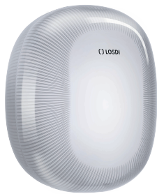
REF: CP-5010-B Acabado BLANCO