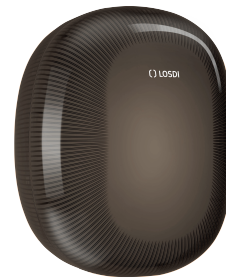
REF: CP-5010-BL Acabado NEGRO