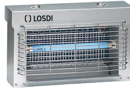
REF: CI-1X11 Acabado ACERO INOXIDABLE