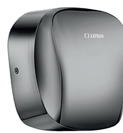
REF: CS-650-S/X Acabado ACERO INOX SATINADO