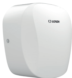
REF: CS-650-X Acabado METAL LACADO BLANCO