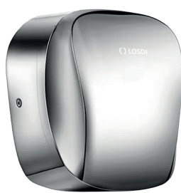
REF: CS-650-I/X Acabado ACERO INOX BRILLO