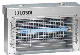
REF: CI-1X11 Finition ACIER INOXYDABLE