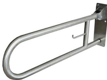
REF: MB-0101-S Finition BROSSE