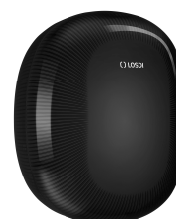
REF: CP-5010-BL Couleur: NOIR