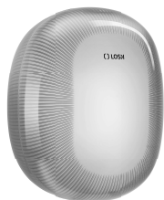
REF: CP-5010-B Couleur: BLANC