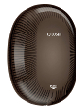
REF: CJ-5005-BL Couleur: NOIR