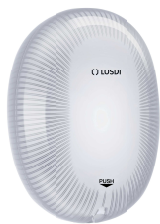
REF: CJ-5005-B Couleur: BLANC