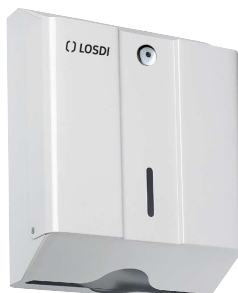
REF: CO-0105 Finition EPOXY BLANC