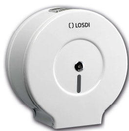
REF: CP-0203 Finition EPOXY BLANC