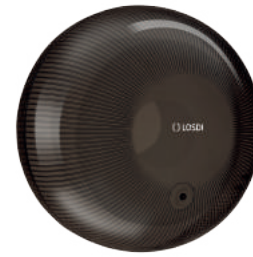
REF: CP-4000-BL Colour NOIR