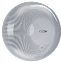
REF: CP-4000-B Colour BLANC