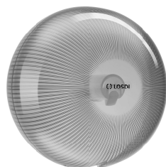
REF: CP-5006-B Couleur: BLANC