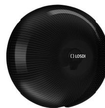
REF: CP-5006-BL Couleur: NOIR