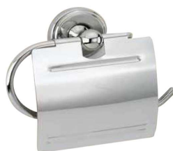
REF: CO-0210-I Finition BRILLANT