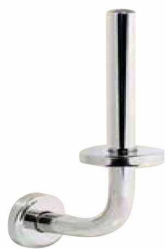
REF: CO-0211-I Finition BRILLANT