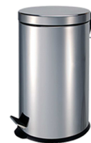
REF: MP-0603-S FINITION SATINER