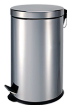
REF: MP-0603-I FINITION BRILLANT