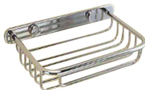
REF: CJ-2000-I Finition CHROMÉ